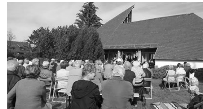
Ökumenischer Generationengottesdienst "Hand aufs Herz"

Dann weist der Pfeil in die richtige Richtung und das könnte dann doch eine Revolution werden. Oder?