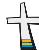
Ev.-Luth. Kirchgemeinden Lindenau-Plagwitz, Tabor, Bethanien

und Schwesternkirchverband Hoffnungskirche Knauthain & Apostelkirche Großzschocher-Windorf