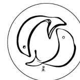
Ev.- Luth. Pauluskirchgemeinde Leipzig- Grünau