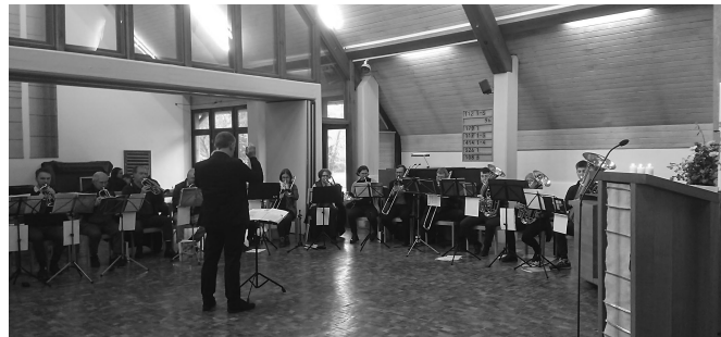
Der Leipziger Bläserkreis spielte am 16. April im Gottesdienst.